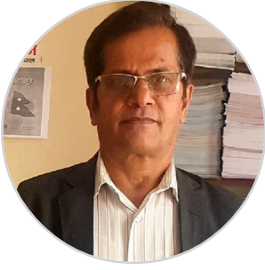
छायादत्त न्यौपाने “बगर”